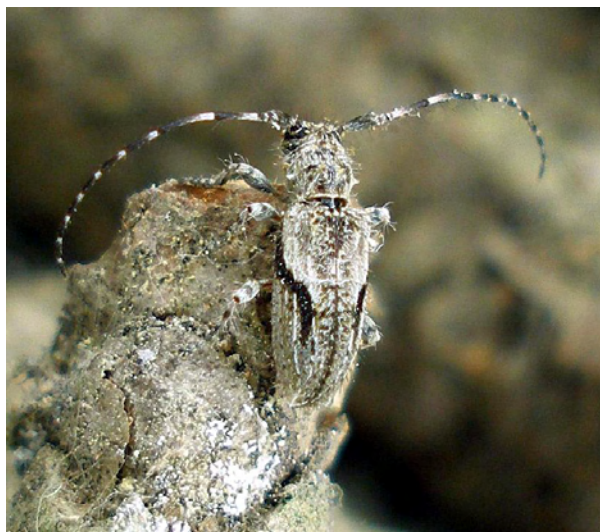
Fig. 2. Individuo procedente de Jaén.

En el Mapa 1 se muestran, en negro, la localidad del Puerto del Arenal, Riópar, Albacete y, en rojo, la nueva localidad que presentamos del Puerto del Campillo, Hornos, Jaén.