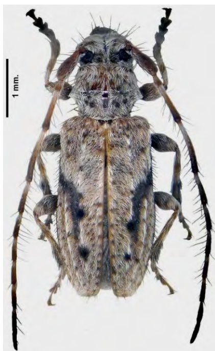
Fig. 1. Hábitus de la especie

Además, en la colección Sama se encuentran individuos ibéricos de las siguientes localidades: Albacete: Puerto del Arenal, Riópar, ex larva de Pinus , 14/19.VII.89; VI.90 (!); Teruel: Albarracin, ex larva de Pinus , VIII.89 (CPS); Puerto Linares, ex larva de Pinus , VIII.89 (CPS). Las siglas CPS indican que estas citas proceden de la colección P. Schurmann, ahora en la coll. Sama. El símbolo (!) que son capturas del primer autor.